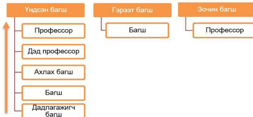
Зураг 2. Багшийн ангилал ба албан тушаалын зэрэглэл

АШУҮИС-ийн багш нь чадварлаг, ёс зүйтэй эрдэмтэн судлаач, салбартаа тэргүүлэгч мэргэжилтэн юм. АШУҮИС нь үндсэн багш, гэрээт багш, зочин багш гэсэн багшлах бүрэлдэхүүнтэй байна (Зураг.2).